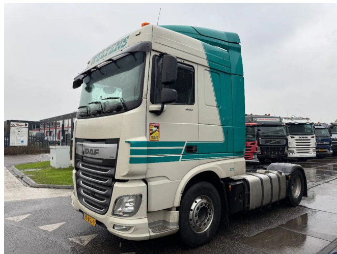
DAF XF 440 4X2 - EURO 6 + ADR + TÜV 09-2025