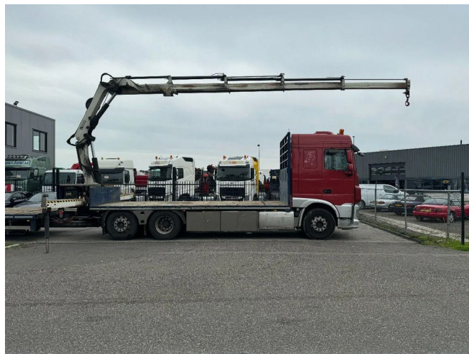
DAF XF 510 6X2 EURO 6 + HIAB 166 HI PRO + REMOTE C...