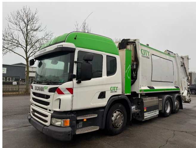
Scania P280 6X2 - EURO 6 + CNG + JOAB BINLIFT L77