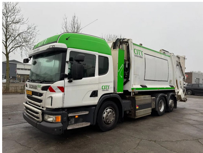
Scania P280 6X2 - EURO 6 + CNG + JOAB BINLIFT L77