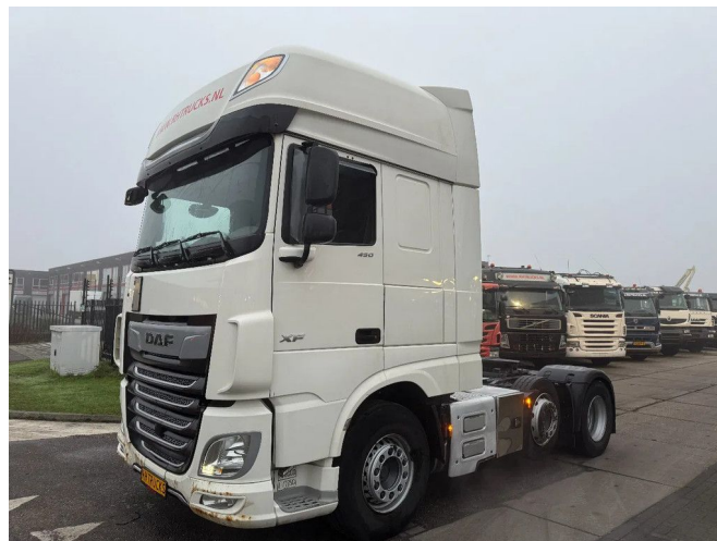
DAF XF 450 6X2 - EURO 6 + LIFT/STEERING AXLE