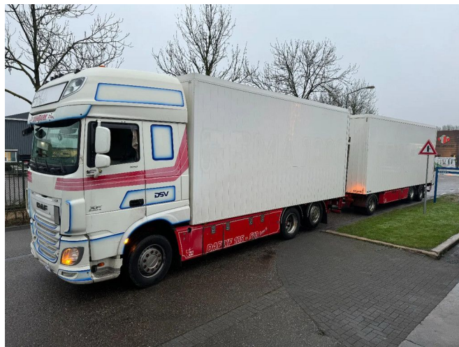
DAF XF 510 6X2 + KELBERG HANGER EURO 6 ZEPRO + ...