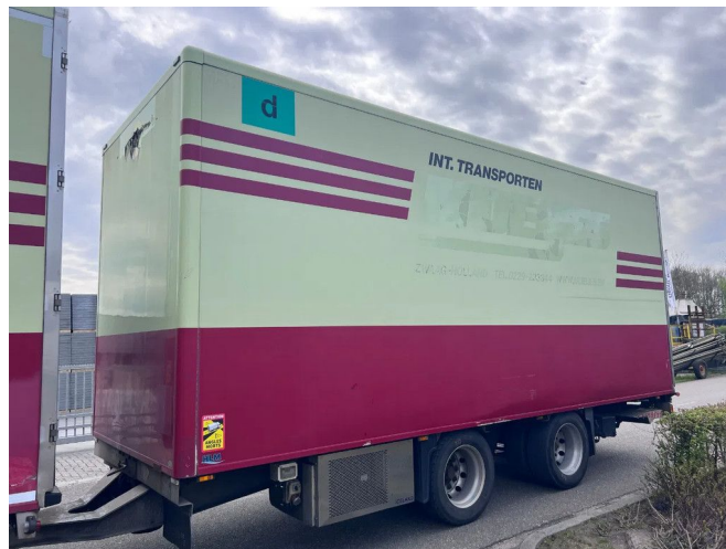
Fliegl TPS 180 - 2 AXLE BPW + TRS COOLING + DHOLLAN...