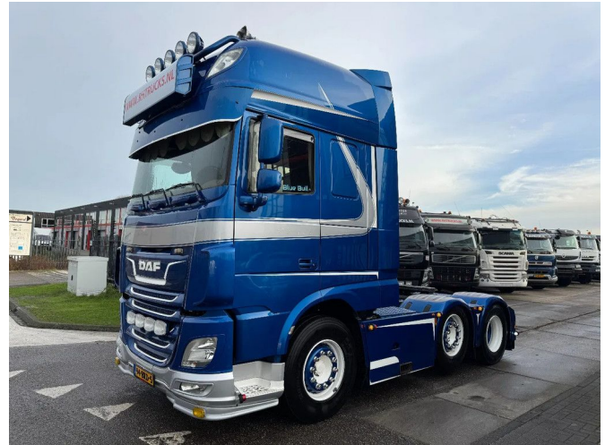
DAF XF 480 6X2 - EURO 6 + LIFT/STEERING AXLE + FULL...