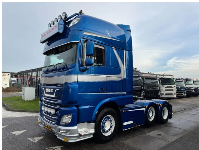
DAF XF 480 6X2 - EURO 6 + LIFT/STEERING AXLE + FULL...