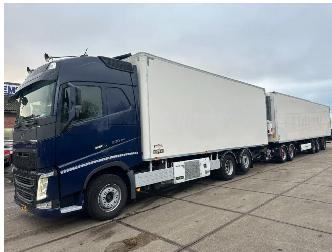
Volvo FH 13.500 LZV COMBI MET THERMO KING KO... 6x2

Referentienummer: VO855407-KR485836-SYFA9512G