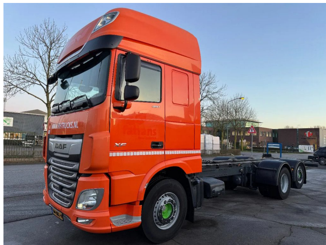
DAF XF 480 6X2 - EURO 6 + LIFT/STEERING AXLE + NIGH...