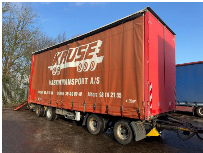
Fliegl VPS 320 HYDRAULIC RAMP 3,15 M 4X BPW AXLE U...