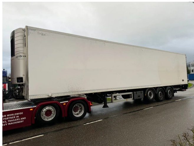
Lamboo 3 AXLE + CARRIER 1550 + DHOLLANDIA - SAF AX...