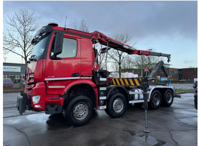
Mercedes-Benz Arocs 4145 8X4 - HMF 2243-Z2 CRANE + R...