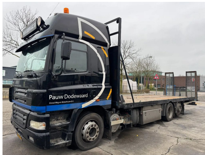
DAF CF 85.340 6X2 - HYDRAULIC RAMP 2M + BED 8.65 M