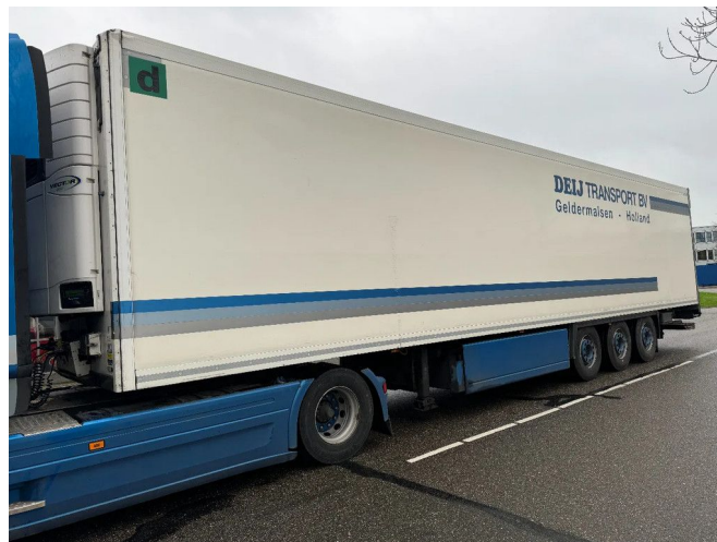
Krone SD 3X SAF AXLE CARRIER VECTOR TÜV TILL 08-2025