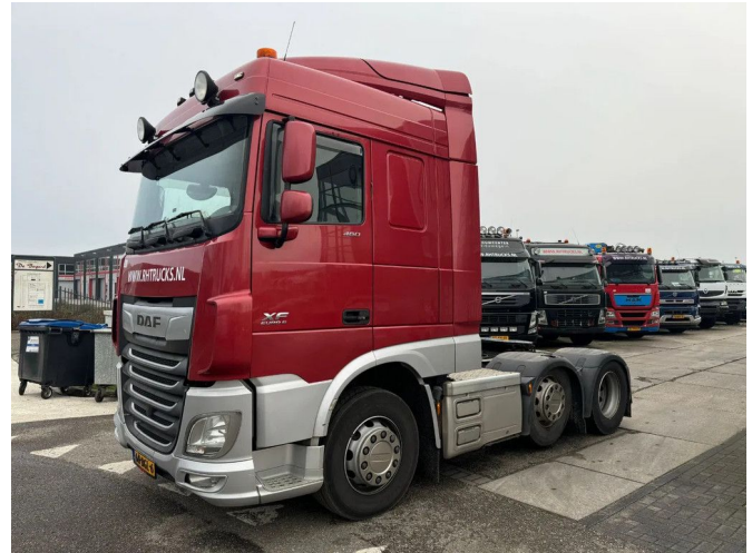
DAF XF 460 6X2 - EURO 6 + LIFT AXLE + TÜV 11-2025