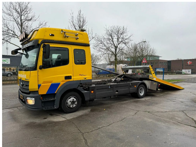
Mercedes-Benz Atego 1224 4X2 - EURO 6 + OMARS SCHUI...