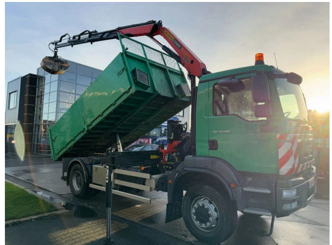
MAN TGM 18.290 4X4 - EURO 5 + PALFINGER PK 12000 + ...