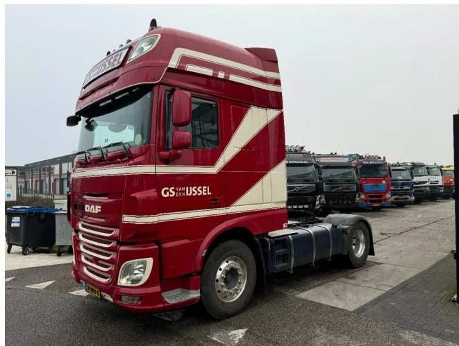
DAF XF 510 4X2 ADR EURO 6 ALCOA TÜV TILL 08-2025