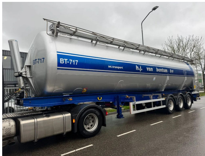
LAG 3 AXLE - KIPPER BULK 1 COMP. 61.000 L - TÜV 10-2025