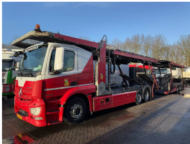
Mercedes-Benz Actros 2643 6X2 - ROLFO + ROLFO HANG...