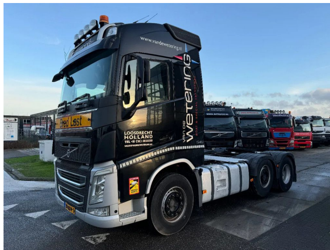
Volvo FH 540 6X2 RETARDER DYNAMIC STEERING I PARK...