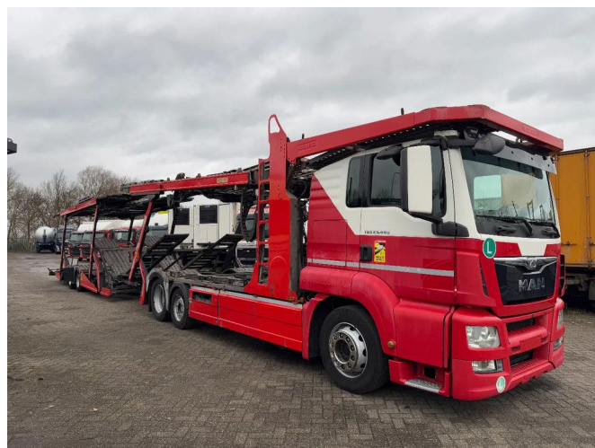
MAN TGS 23.440 - ROLFO + ROLFO HANGER - CAR T... 6x2