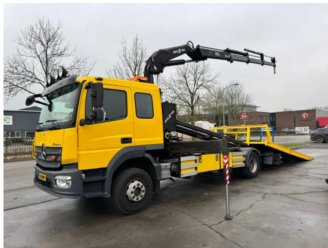
Mercedes-Benz Atego 1823 4X2 FALKOM 5000 + REMOTE ...