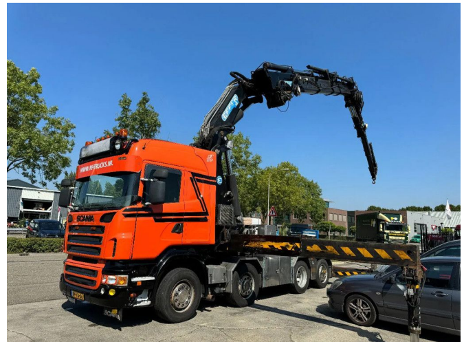
Scania R560 V8 8X2 + EFFER CRANE 1550 6S + FLYJIP 6...