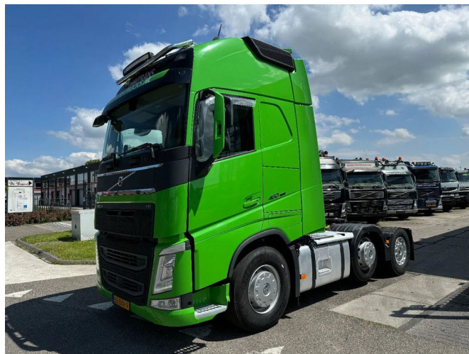
Volvo FH 460 6X2 EURO 6D + STEERING AXLE + HYDRAU...