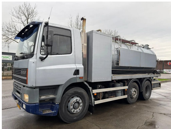
DAF 85.330 6X2 - VACUUM CLEANER + LIFT/STEERING A...