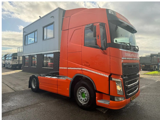
Volvo FH 460 4X2 I PARK COOL EURO 6 I SHIFT TÜV TILL ...