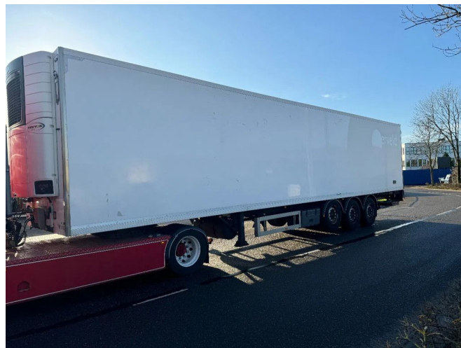
TECNO KAR CARRIER VECTOR 1550 3X SAF AXLE tÜV TIL...