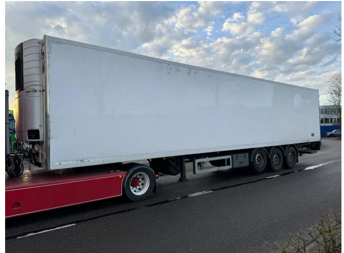
TECNOKAR CARRIER VECTOR 1550 3X SAF AXLE