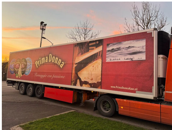
Krone SD + CARRIER VECTOR 1850 + 3X SAF AXLES