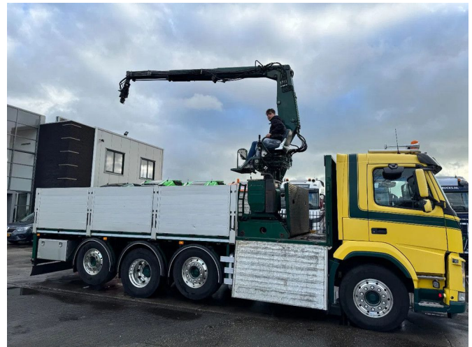
Volvo FM 460 8X2 - EURO 6 + KENNIS 14.000-R ROLLER - ...