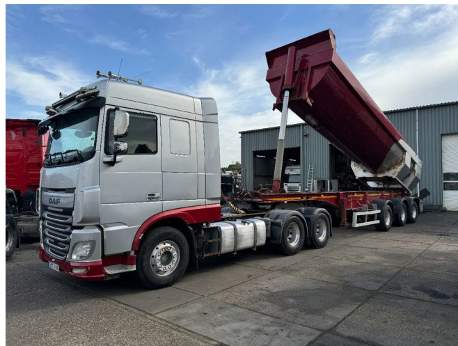
DAF XF 510 6X4 + KIPPER TRAILER