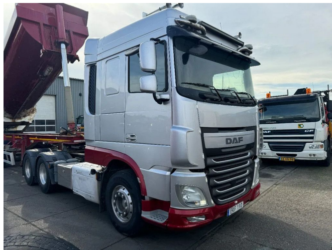
DAF XF 510 6X4 EURO 6 HYDRAULIC