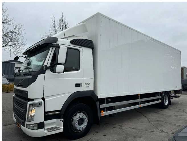
Volvo FM 330 4X2 - EURO 6 + DHOLLANDIA LIFT + ONLY 5...