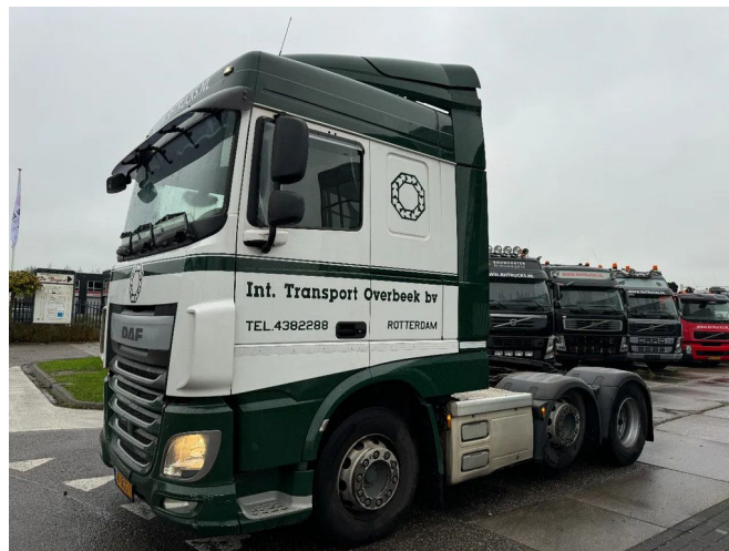
DAF XF 460 6X2 - EURO 6 + LIFT AXLE + STEERING AXLE