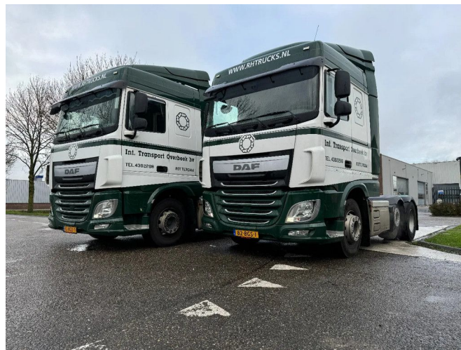
DAF XF 460 6X2 2 UNITS!! EURO 6 SPOILERS STEERING ...