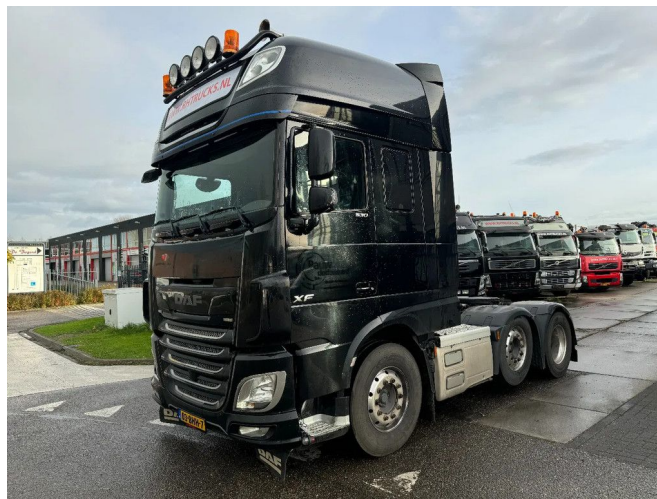
DAF XF 460 6X2 EURO 6 STEERING AXLE HYDRAULIC