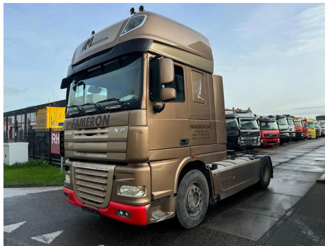
DAF XF 105.410 4X2 - EURO 5 + MANUAL GEAR