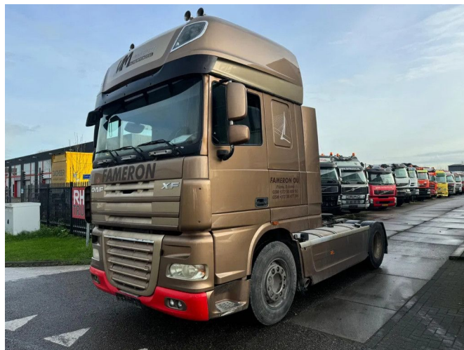
DAF XF 105.410 4X2 - EURO 5 + MANUAL GEAR