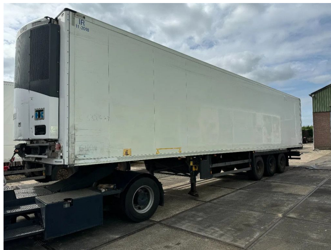
Schmitz Cargobull THERMO KING SLXE200 BPW AXLE