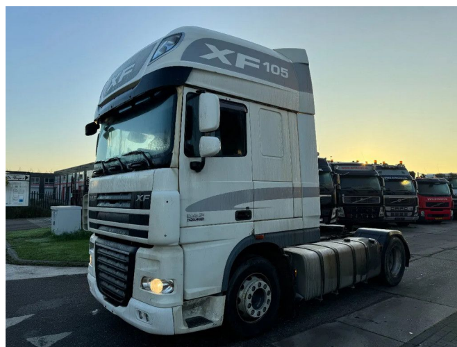
DAF XF 105.460 4X2 - EURO 5 + MANUAL GEAR