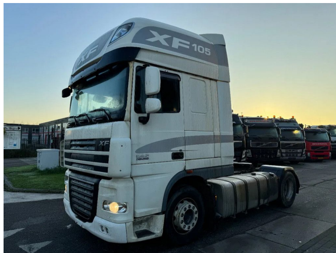
DAF XF 105.460 4X2 - EURO 5 + MANUAL GEAR