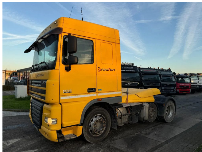
DAF XF 105.460 6X2 - EURO 5 + LIFTING AXLE