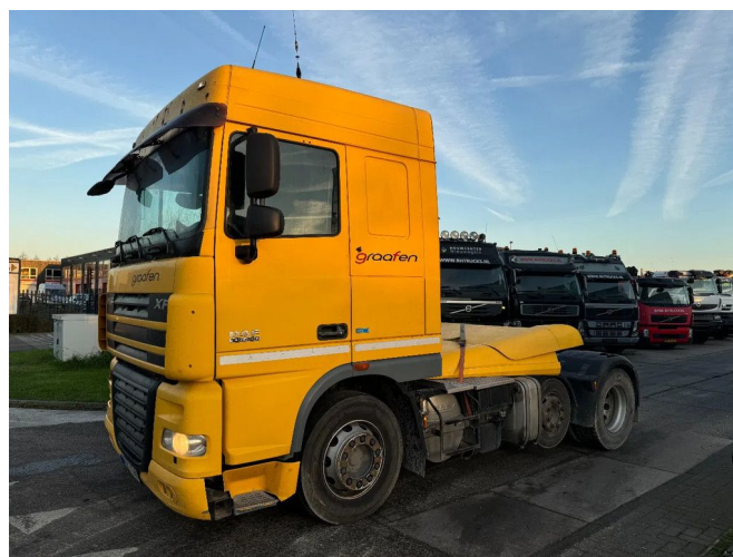
DAF XF 105.460 6X2 - EURO 5 + LIFTING AXLE