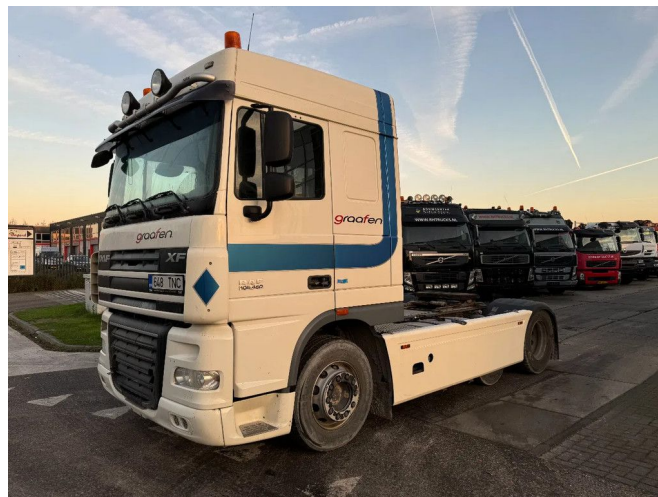
DAF XF 105.460 6X2 EURO 5 SKIRTS MANUAL GEAR HY...