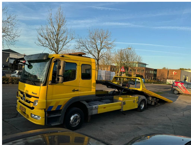
Mercedes-Benz Atego 1224 4X2 - EURO 5 + TISCHER 2 CA...