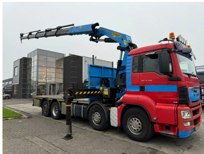
MAN TGS 35.400 8X2 + PK50002-EH PALFINGER + REMO...