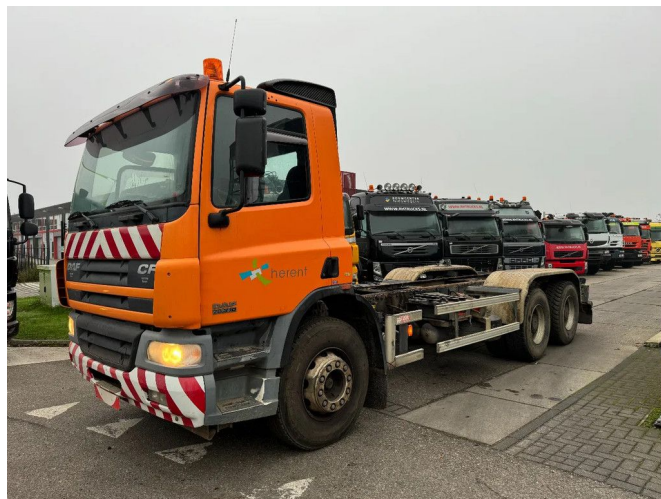
DAF CF 75.310 6X4 MANUAL GEAR EURO 3 FULL STEEL